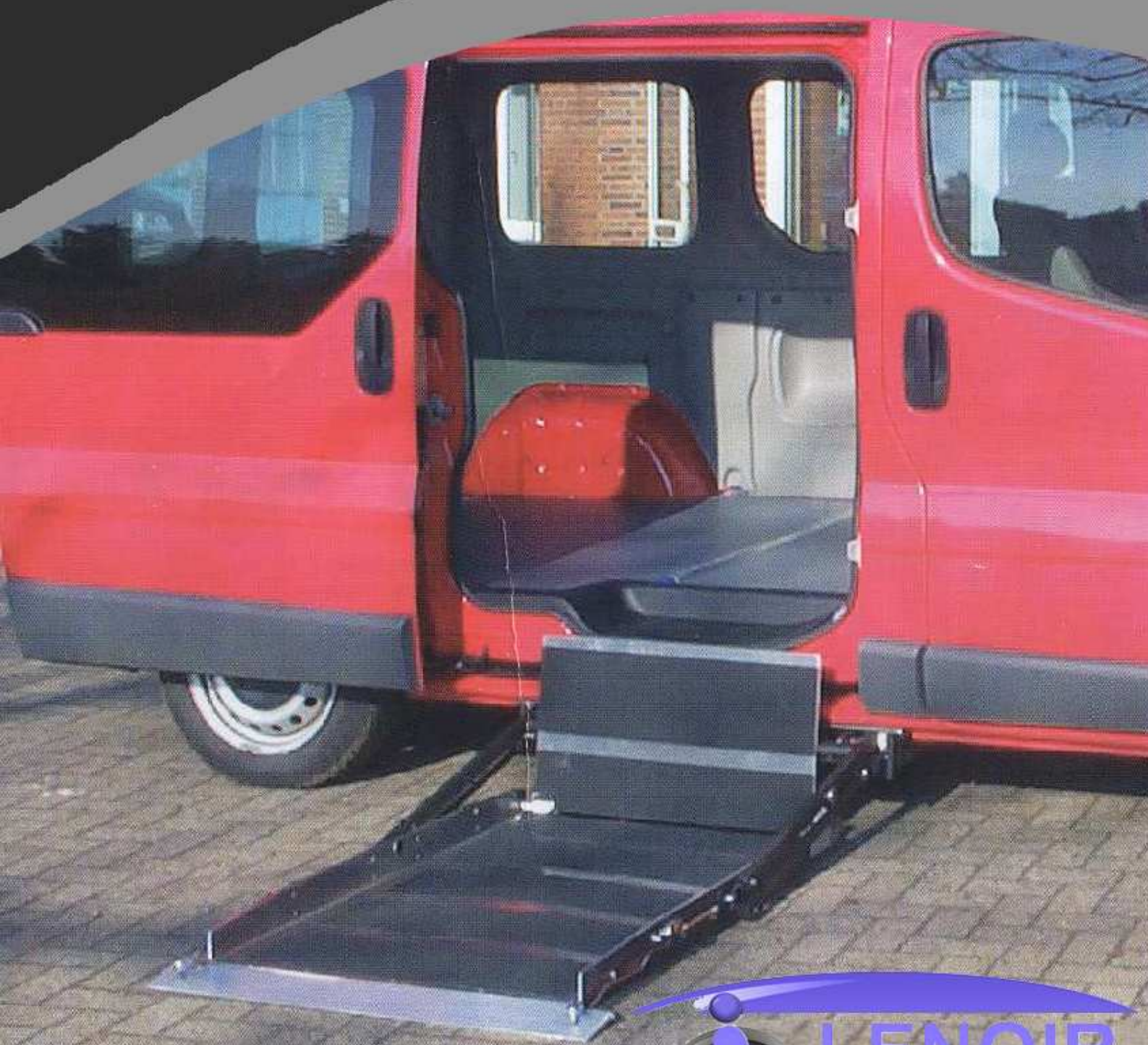
Plate-forme sous plancher