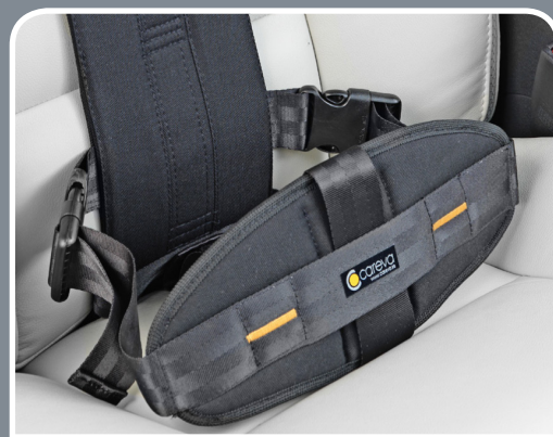
CEINTURE PELVIENNE EN «T»

CES HARNAIS NE SE SUBSTITUENT PAS À LA CEINTURE DE SÉCURITÉ DU VÉHICULE, CETTE DERNIÈRE RESTANT OBLIGATOIRE.