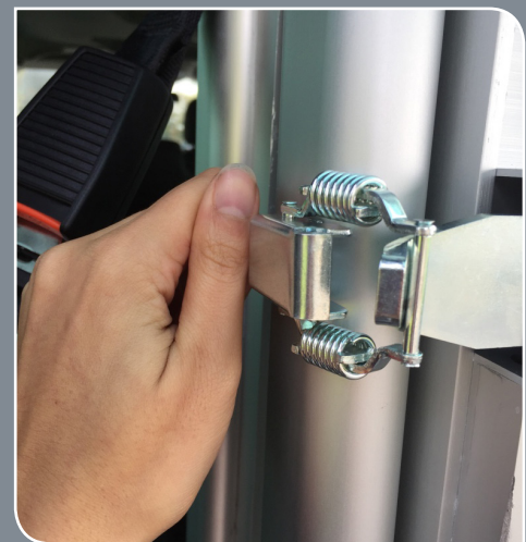
CLIPS DE VERROUILLAGE