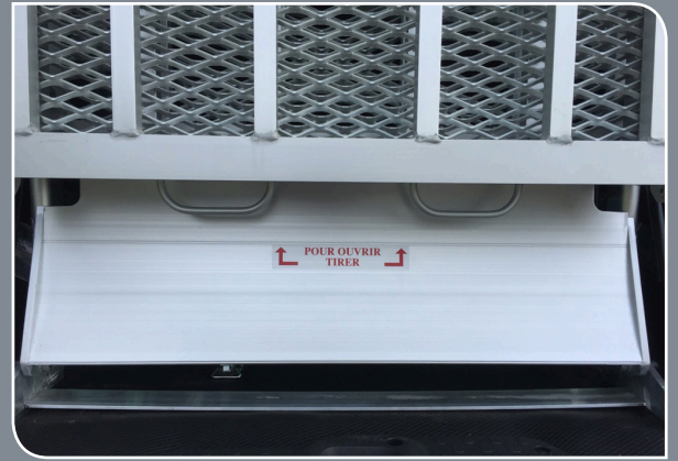
POIGNÉES POUR DÉPLIER LA RAMPE