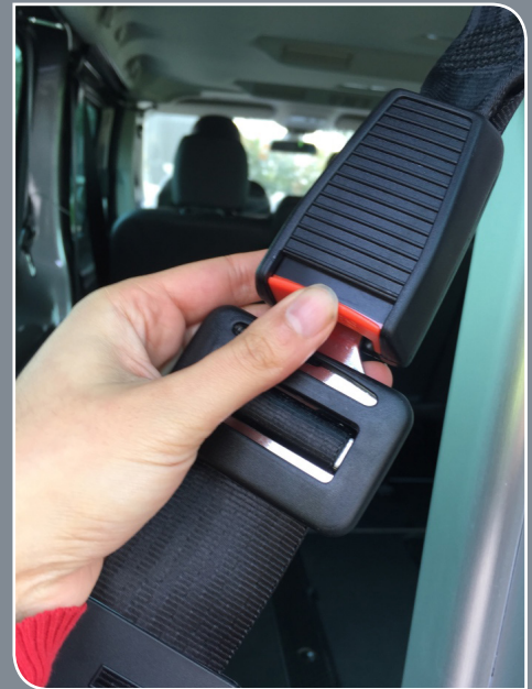
BOUCLE DE MAINTIEN