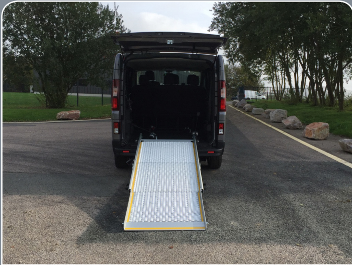
RAMPE 3 VOILETS DÉPLIÉE