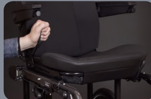
Assise et lombaire réglables pour plus de confort