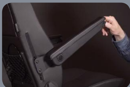
Inclinaison et hauteur des accoudoirs réglables