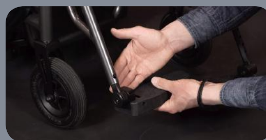
Repose-pieds réglables en hauteur