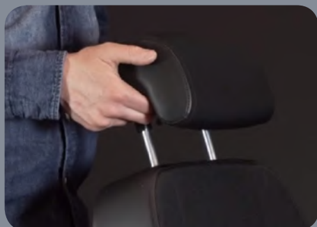
Appui-tête réglable en hauteur